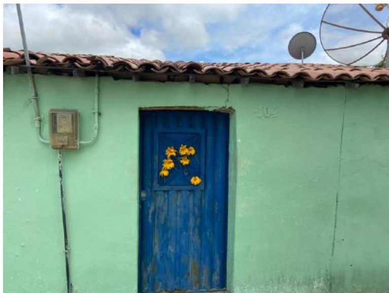
Figura 5 – Flores nas portas das casas para saudar Santa Maria no dia 01 de maio