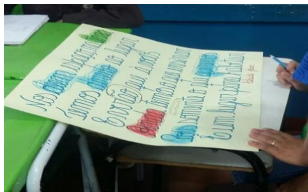
Imagem 1: Jogo “Latinha Gramatical do Poema

Em seguida, pedimos para cada aluno construir um poema que tratasse dos direitos do povo indígena.