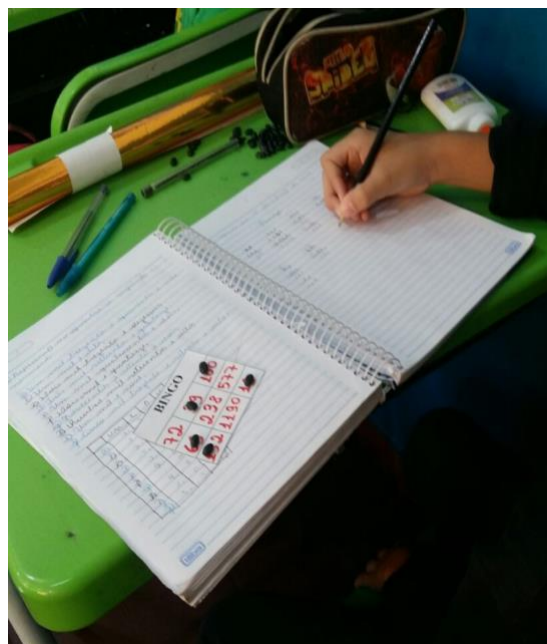
Imagem 5: Jogando o “Bingo das Situações Problema”