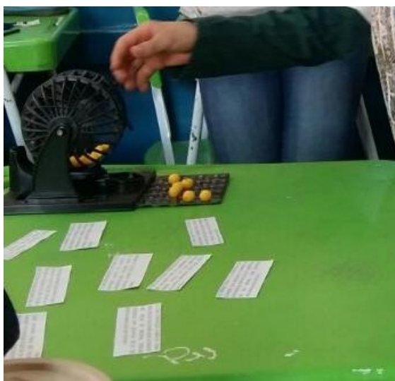
Imagem 4: Jogando o “Bingo das Situações Problema”

Ao final do jogo, cada aluno registrou em seu caderno os cálculos resolvidos pelos colegas no quadro.