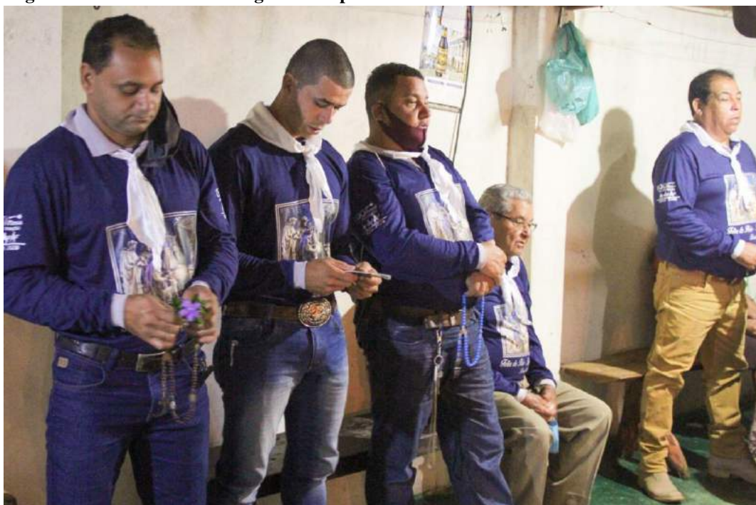
Figura 1: Folia de Reis - Protagonismo e predominância de homens.

A celebração da Folia de Reis em Lagolândia é realizada entre os dias 25 e 31 de dezembro. Durante os festejos, os homens, em sua maioria da zona rural, assumem os papéis principais da festa. Cabe a eles o rito da música, das rezas e a organização dos trajetos entre as casas dos moradores do distrito. De acordo com observações e relatos de moradores, vestem-se de roupas que identificam e uniformizam o grupo, com camisas em tons de azul, botas, cintos com presilhas e fivelas prateadas ou douradas, chapéus e lenços (cachecol) no pescoço. As funções femininas ficam restritas à alimentação e a participação em parte dos cultos religiosos, realizados no interior das residências.