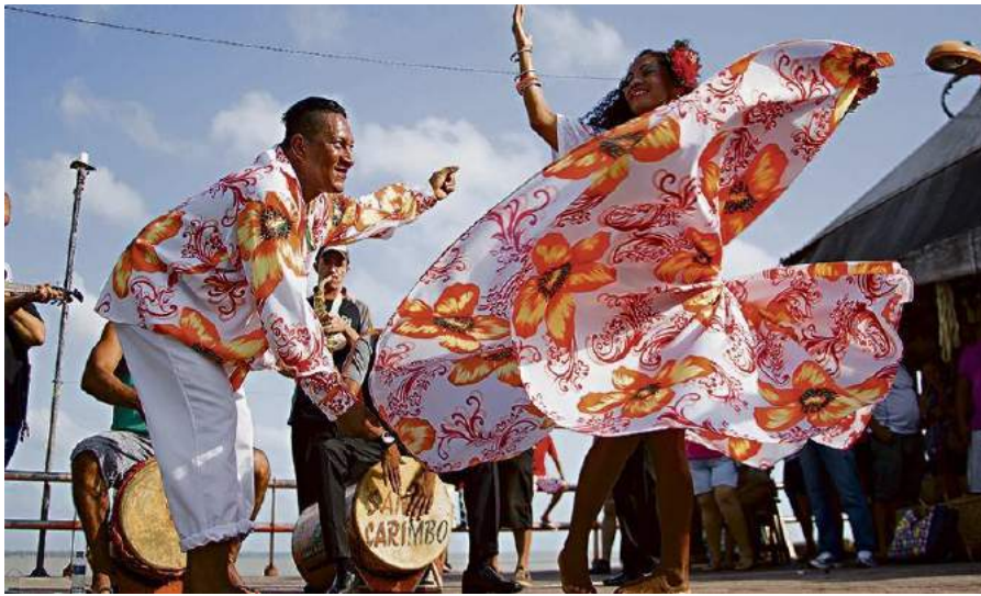
Imagem 2: # Para Todo Mundo Ver Casal de dançarinos com Indumentária do carimbó