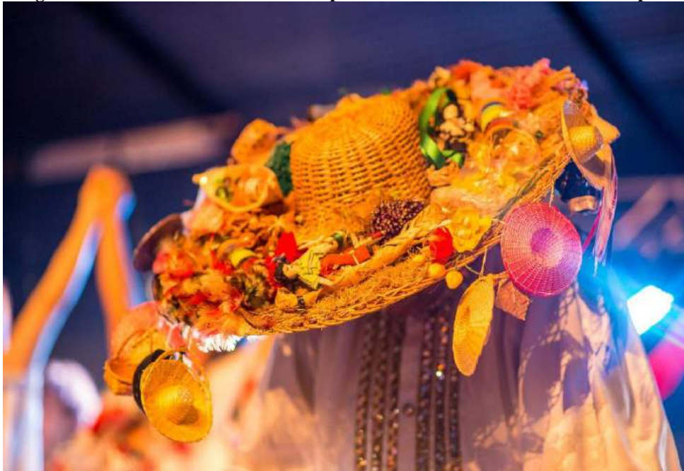
Imagem 4: # Para Todo Mundo Ver Chapéu do Mestre Pinduca durante suas apresentações