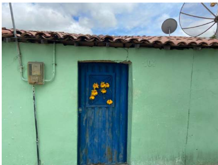
Figura 5 – Flores nas portas das casas para saudar Santa Maria no dia 01 de maio