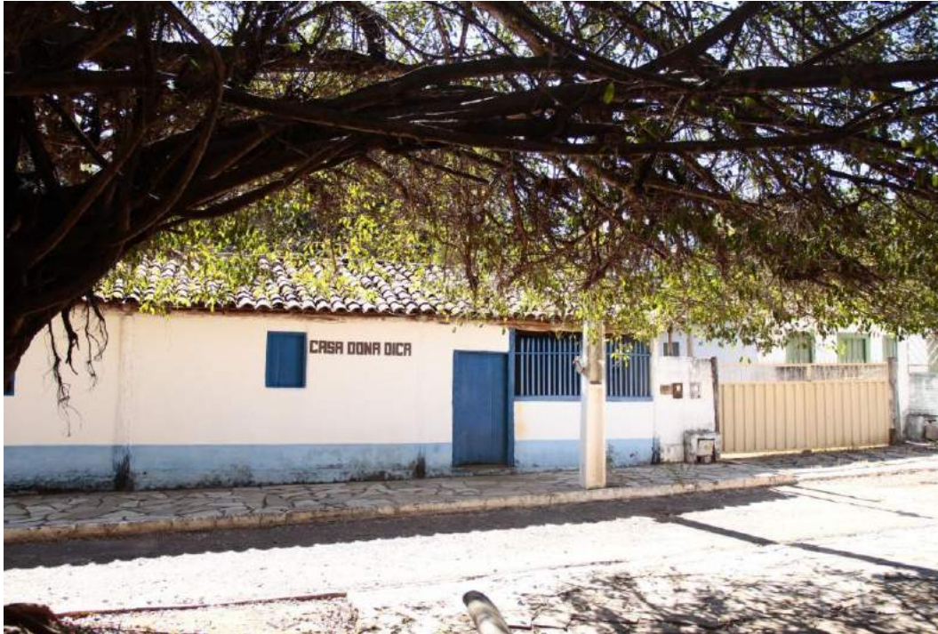
Figuras 4 e 5: Casa de Santa Dical. Em frente, seu túmulo na praça central