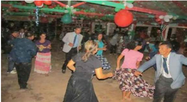
Imagem 3: # Para Todo Mundo Ver Indumentárias de carimbó na Festividade de São Benedito - Santarém Novo