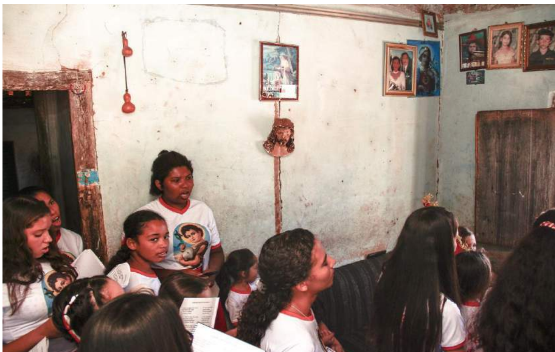
Figura 3: Grupo de foliões da Folia de São João - Folia realizada por mulheres