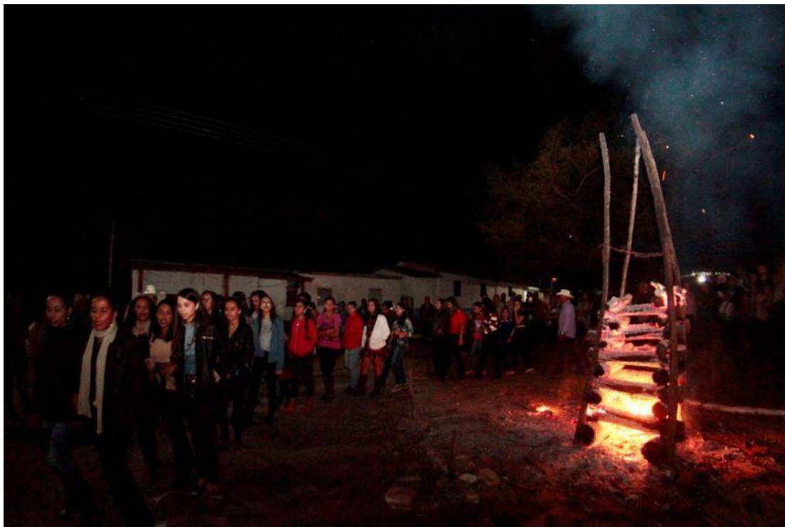
Figura 2: À meia noite as mulheres circulam a fogueira no ritual que dá início à Folia.