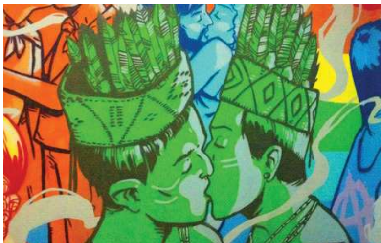
Figura 1: Grafitti de Oz Montonia, na sede do grupo SomosGay, em Asunción, Paraguai.