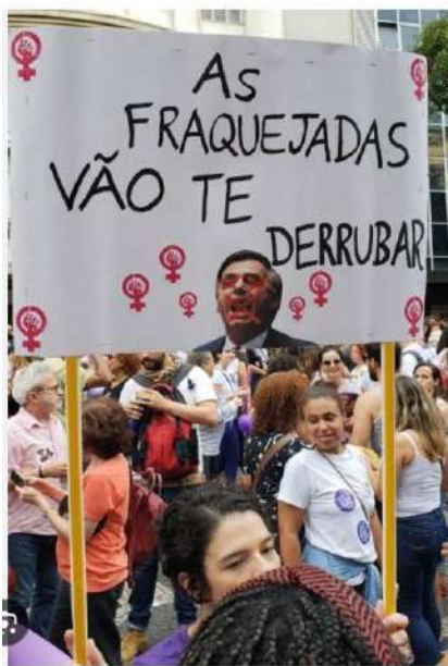
Figura 01: As fraquejadas vão te derrubar

Manifestação na Cinelândia, Rio de Janeiro (RJ), 29 de setembro de 2018. #PraTodoMundoVer mulher branca segura placa escrito “as fraquejadas vão te derrubar” com símbolos do feminismo, com foto do Bolsonaro com um “X” em vermelho em seu rosto em meio a manifestação do #EleNão.