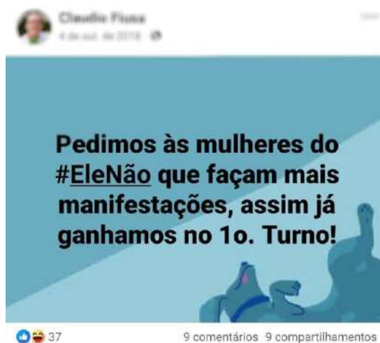
Figura 03: #EleNão e Manifestações

Comentário público no Facebook de 04 de outubro de 2018 #PraTodoMundoVer texto da imagem “Pedimos às mulheres do #EleNão que façam mais manifestações, assim já ganhamos no 1º turno!”