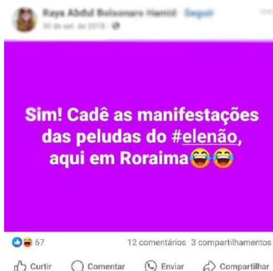
Comentário público no Facebook de 30 de setembro de 2018 #PraTodoMundoVer texto da imagem “Sim! Cadê as manifestações das peludas do #elenão, aqui em Roraima emoji de riso”.

Em ambos os comentários visualizamos o quanto a divulgação de imagens da Marcha das Vadias e de outras performances foi essencial para o fortalecimento da direita brasileira naquele momento.