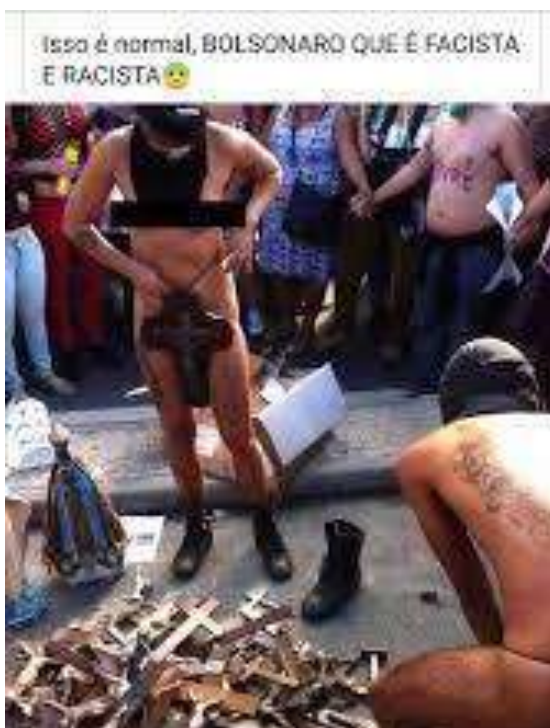
Figura 02: Performance Marcha das Vadias

#PraTodoMundoVer performance da Marcha das Vadias no Rio de Janeiro, onde as genitais são tapadas por símbolos religiosos, como a cruz.