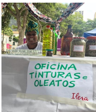
Figura 3: Natália no SESC Rio de Janeiro, 2024. #PraTodoMundoVer A imagem conta com a presença da Nat, uma das integrantes da Ilera, atrás de uma mesa com os produtos da loja Ilera e óleo para a oficina de tinturas e oleatos.

Em 2020, Leila retorna a São Paulo para dar continuidade a seu mestrado na UNICAMP e começa a refletir sobre a adaptação e expansão da Ilera no contexto urbano paulista, buscando integrar essas experiências e conhecimentos ancestrais em novas abordagens para o cuidado e a saúde na cidade.