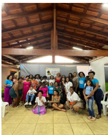
Figura 4: Articulação de Mulheres Negras Brasileiras, 2024. #PraTodoMundoVer A imagem é uma foto que registra a presença das integrantes da Ilera em um encontro de articulação com várias mulheres negras e alguns de seus filhos.