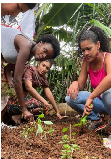
Figura 5: Ilera em ação de plantio, 2023