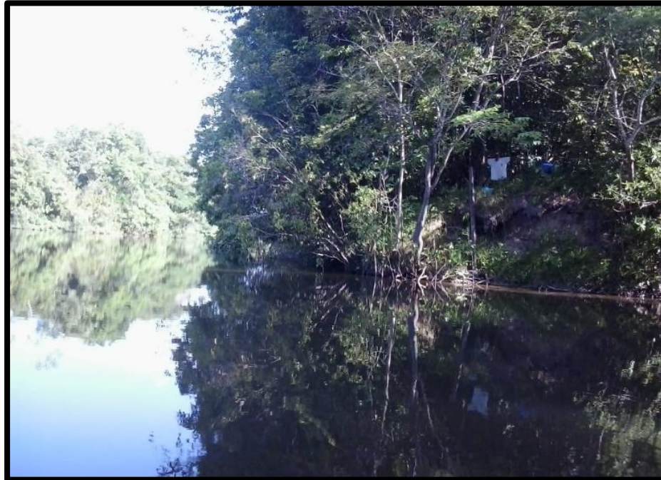
Imagem 1– “Boca dos Anjinhos”