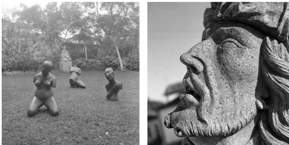
Figura 5. Conjunto de obras de Felícia Leirner, Campos do Jordão, c. 1956, por Alice Brill, à esquerda. Profeta Jonas, Congonhas, c. 1947, à direita. Fonte: Instituto Moreira Salles.

Com relação à fotografia da escultura do Profeta Jonas (Figura 5), realizada por Marcel Gautherot, vemos um processo semelhante de humanização, nesse caso por um movimento quase contrário ao de Alice: o isolamento de cada obra, apartadas de seu conjunto, o complexo dos Doze Profetas de Aleijadinho. Nesse registro específico, Gautherot realiza uma grande aproximação frente às esculturas, com objetivo de dar destaque a seus rostos, que sangram para além do recorte da imagem. Dessa forma, o fotógrafo valoriza a expressão facial esculpida e dá ênfase para a emoção que o artista congelou no tempo. O movimento de aproximação contribui para a construção de uma perspectiva radicalmente diferente daquela do observador que experiencia a obra, dado que seu olhar estaria “na altura da base das estátuas, e a visão predominante é aquela que se tem de baixo, ou de longe, do conjunto. Esse aspecto mostra o cálculo do fotógrafo ao se buscar um determinado efeito que espontaneamente a obra não produz” (MANNARINO, 2020, p. 9).