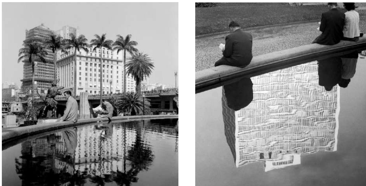
Figura 1. Vale do Anhangabaú (Praça Ramos de Azevedo) registrado por Alice Brill, c. 1953, à esquerda. Fonte: Instituto Moreira Salles. O mesmo espelho d'água, no Vale do Anhangabaú, registrado por Marcel Giró, c. 1950, à direita. Fonte: Marcel Giró Estate.

Apesar de quase metade da fotografia ser tomada por água, não há prevalência de um vazio. O reflexo atua como elemento constitutivo da imagem que, ao duplicar a cena, cria uma sensação de completude, por torná-la geometricamente mais coesa. O quadrado que se forma com as palmeiras reforça o próprio formato original da fotografia, fruto da utilização de uma câmera Rolleiflex , que realiza fotografias em formato de 6 por 6 centímetros. A opção por registros quadrados é prevalente em quase toda a produção de Alice, com poucas exceções.