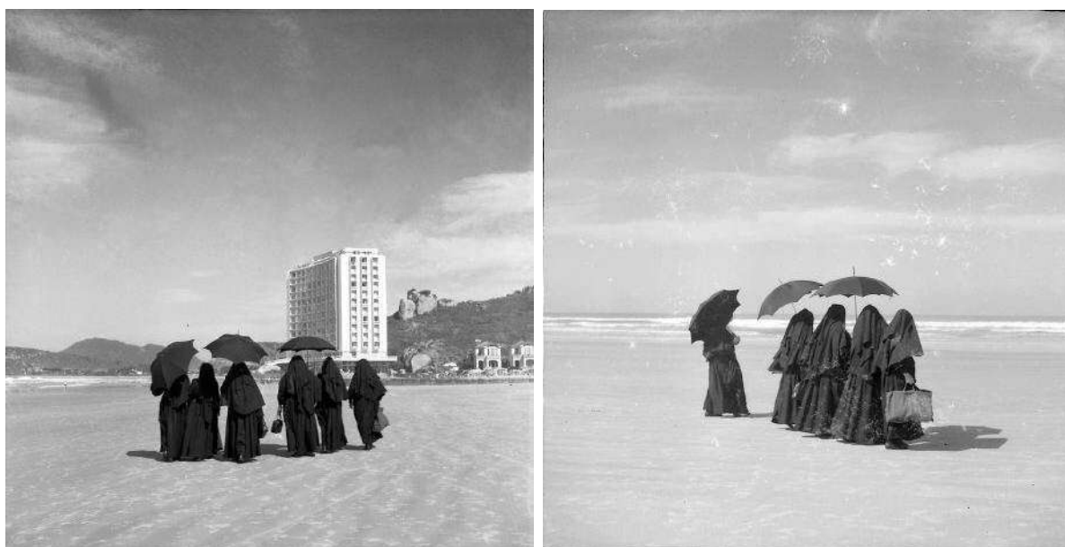
Figura 4. Freiras na Praia das Pitangueiras, Guarujá, c. 1954, por Alice Brill. Fonte: Instituto Moreira Salles

Ao observarmos as duas maneiras distintas que Alice escolheu para registrar o momento em que um grupo de freiras passeavam pela Praia das Pitangueiras, no Guarujá (SP), conseguimos perceber como uma mesma cena pode produzir fotografias profundamente diferentes (Figura 4). Isto porque, a possibilidade de se registrar um “instante decisivo” 6 não reside apenas na observação atenta da dinâmica que se desenrola à frente da câmera, depende também das escolhas do próprio fotógrafo acerca do enquadramento, composição e momento do disparo. Assim, o “instante decisivo” não está dado ao fotógrafo, à espera de ser capturado, mas é construído por ele.