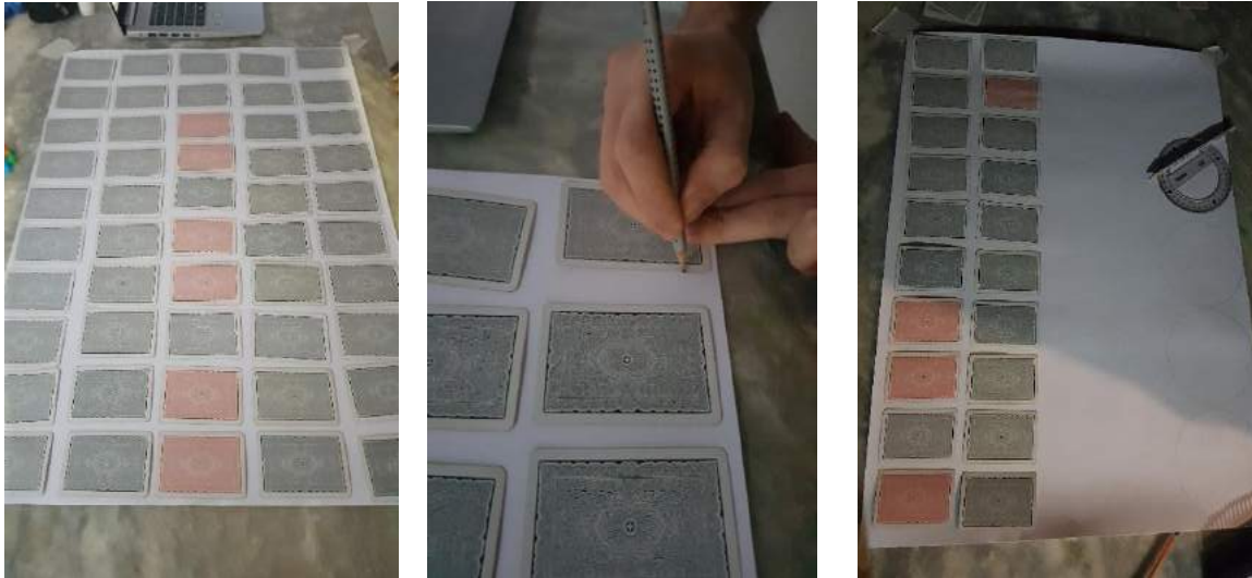
Mosaico de Figuras 1 - Confeção das casas do jogo

Com a primeira folha de cartolina fixada com fita sobre a mesa utilize a régua ou seu objeto com a medida de referência, se optar pelas cartas do baralho use as nesta ordem para obter o máximo de casas utilizando bem o espaço da cartolina. Passe o lápis realizando o contorno. Será necessário para o jogo 63 casas, mas é sempre bom fazermos algumas extras pois poderemos errar em qualquer momento, na hora em que estivermos desenhando principalmente, fizemos algumas extras na segunda folha da cartolina. Na terceira Imagem do Mosaico de figuras 1, observe que ao final da cartolina fizemos 4 círculos utilizando a régua oval que servirá para fazermos as cartas do oráculo e o oráculo em si.