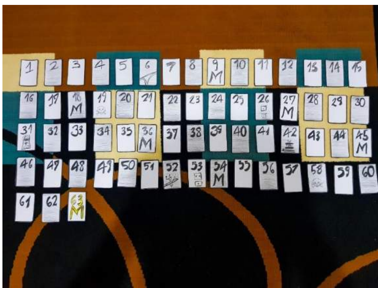
Figura 1 - As casas do jogo - desenhadas e pintadas

Com a primeira folha de cartolina fixada com fita sobre a mesa utilize a régua ou seu objeto com a medida de referência, se optar pelas cartas do baralho use as nesta ordem para obter o máximo de casas utilizando bem o espaço da cartolina. Passe o lápis realizando o contorno. Será necessário para o jogo 63 casas, mas é sempre bom fazermos algumas extras pois poderemos errar em qualquer momento, na hora em que estivermos desenhando principalmente, fizemos algumas extras na segunda folha da cartolina. Na terceira Imagem do Mosaico de figuras 1, observe que ao final da cartolina fizemos 4 círculos utilizando a régua oval que servirá para fazermos as cartas do oráculo e o oráculo em si.