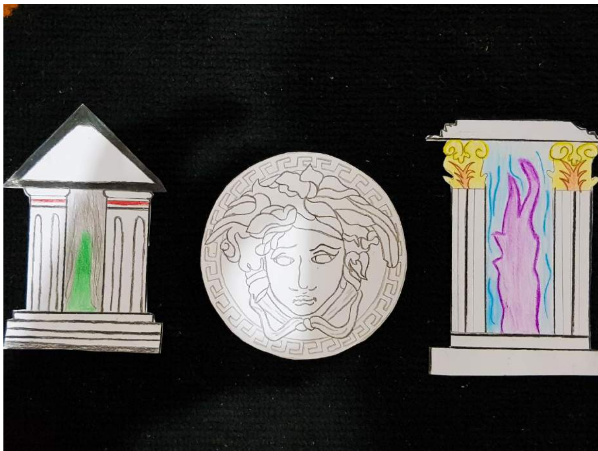
Figura 3 - Os portais e a Medusa

Após desenhar e colorir as cartas do Oráculo, precisaremos por último fazer os dois portais gregos necessários e um desenho da Medusa para colocarmos no meio do jogo representando o Jardim das Medusas.