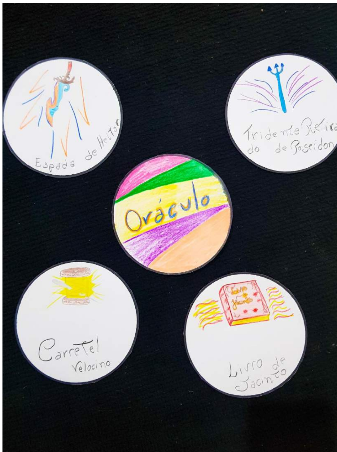
Figura 2 - O oráculo e suas cartas de poder

Observe a Figura 2. Após cortar e fazer as margens com a canetinha ou canetão preto e desenhar e colorir. Temos as casas do nosso jogo. Faltando agora vermos como ficou as cartas do Oráculo (Figura 3) responsável por dar poder aos piões do jogo e definir o que é cada jogador ou jogadora.