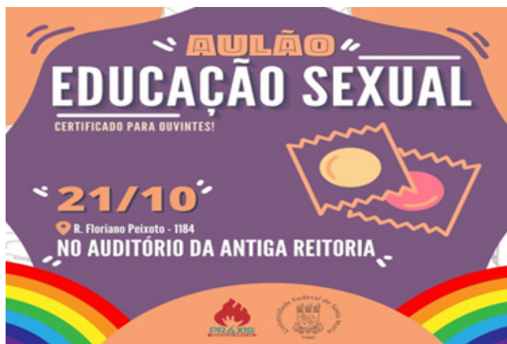
Figura 2 – Cartaz Aulão Educação Sexual

O evento teve uma formatação aberta ao público. O público-alvo foi o componente prévio do Coletivo Práxis, além de ser aberto à comunidade em geral, buscando atingir a maior quantidade de pessoas e grupos sociais possíveis. A iniciativa foi divulgada através da confecção de cartazes e realização de postagens nas redes sociais do Coletivo (Figura 2), além do convite direto dentro do Coletivo. A estratégia de divulgação tinha como objetivo garantir que a organização pudesse chegar a diferentes públicos, aproximando a comunidade local das discussões que ocorrem dentro da universidade e integrando saberes científicos e populares.