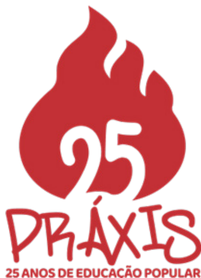
Figura 1 – Logotipo de 25 anos do Coletivo Práxis

freireano para pessoas de baixa renda, com o objetivo de oportunizar o ingresso das camadas populares na universidade (OLIVEIRA, 2009, p. 81).