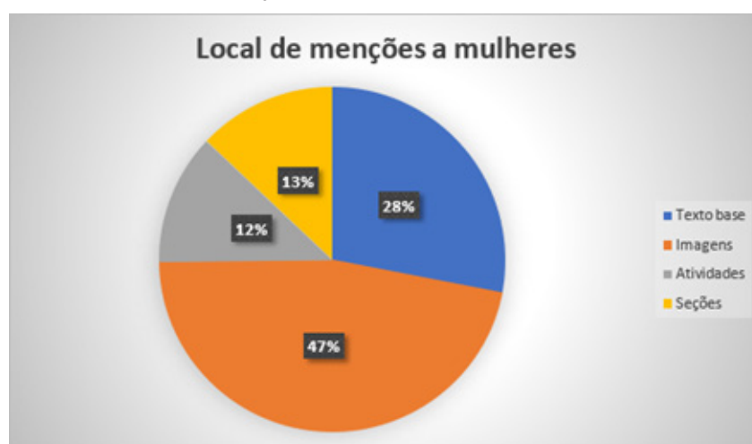
Figura 02 – Gráfico que apresenta o espaço das mulheres nos Livros Didáticos na coletânea Moderna Plus

Nos gráficos supracitados, podemos ter acesso aos dados quantitativos relativos ao espaço destinado à mulher nos Livros Didáticos aqui selecionados. Para a construção desses gráficos foram observadas e contabilizadas as aparições femininas e suas representações que permeiam todo o Livro Didático, sendo separadas de acordo com a própria estrutura do livro, assim temos: texto-base imagens, atividades e seções.