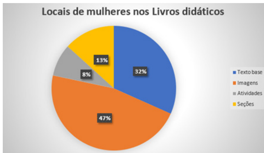
Figura 03 – Local das mulheres na coletânea Identidade em Ação

cia que as representações femininas estejam presentes nesses espaços. A maior utilização dessas representações através de imagens levanta questionamentos sobre o caráter ilustrativo em que essas mulheres são colocadas.