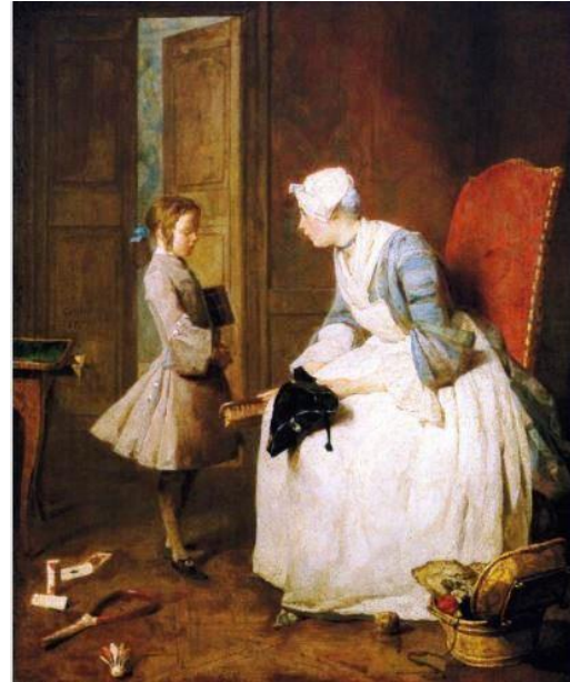
Figura 2 – A governanta de Chardin (1739)

aconselhamento ao rapaz, sobre o que lhe espera no mundo escolar, já que dela recebeu em casa a alfabetização. A governanta pintada Jean-Baptiste-Siméon Chardin era também preceptora.