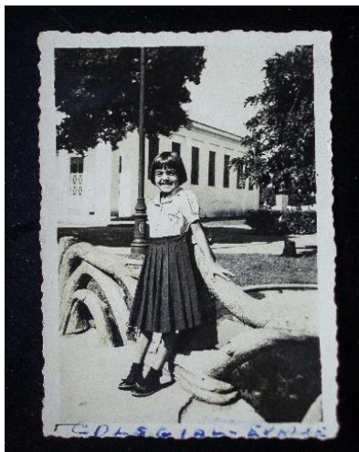
Figura 5 Foto da autora com uniforme de sua primeira escola- 1952