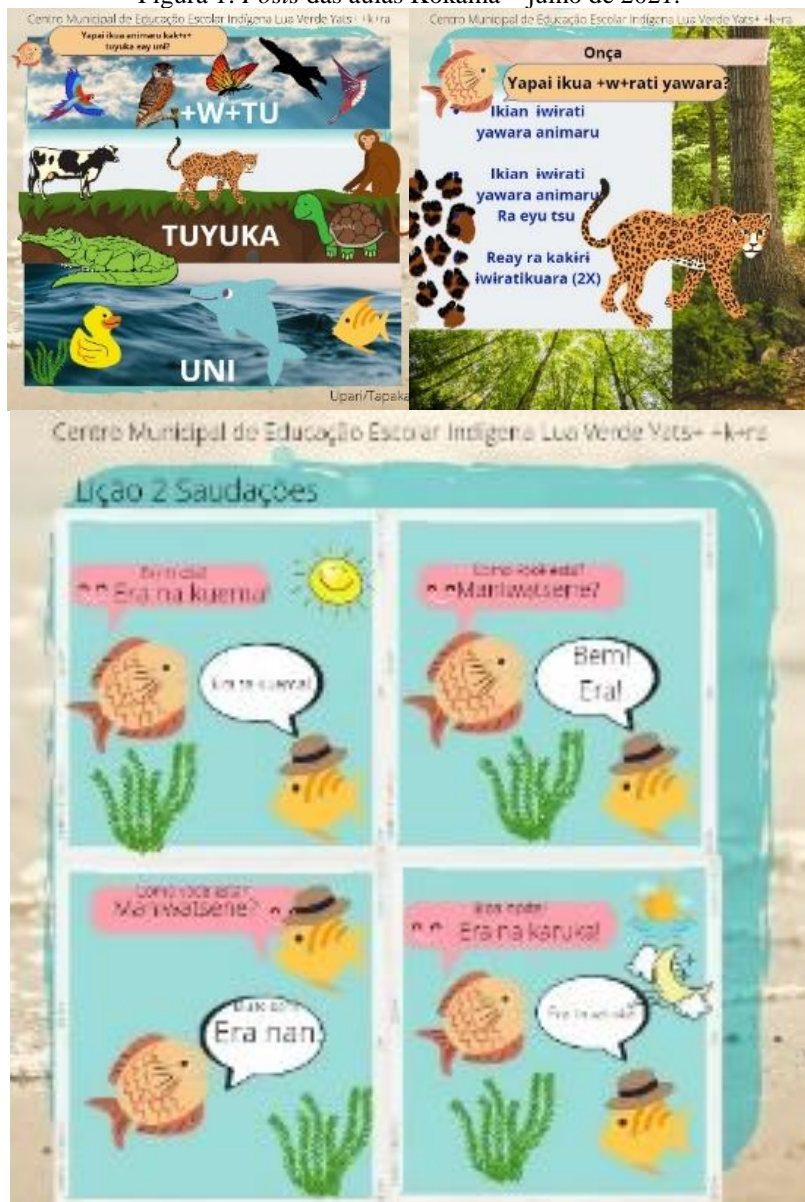
Figura 1: Posts das aulas Kokama – julho de 2021.