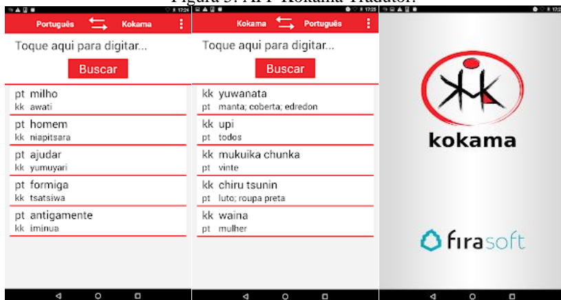
Figura 5: APP Kokama Tradutor.