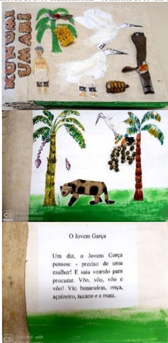
Figura 3: Amostra do livro tridimensional – A história do Jovem Garça (2019)