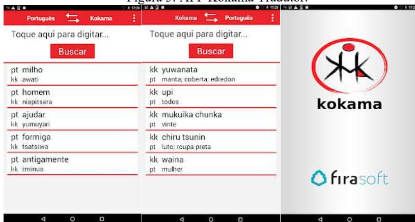
Figura 5: APP Kokama Tradutor.