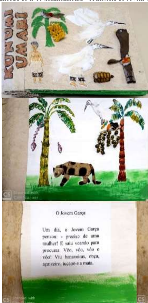
Figura 3: Amostra do livro tridimensional – A história do Jovem Garça (2019)

Fonte: “A história do Jovem Garça”, por Rubim (2019).