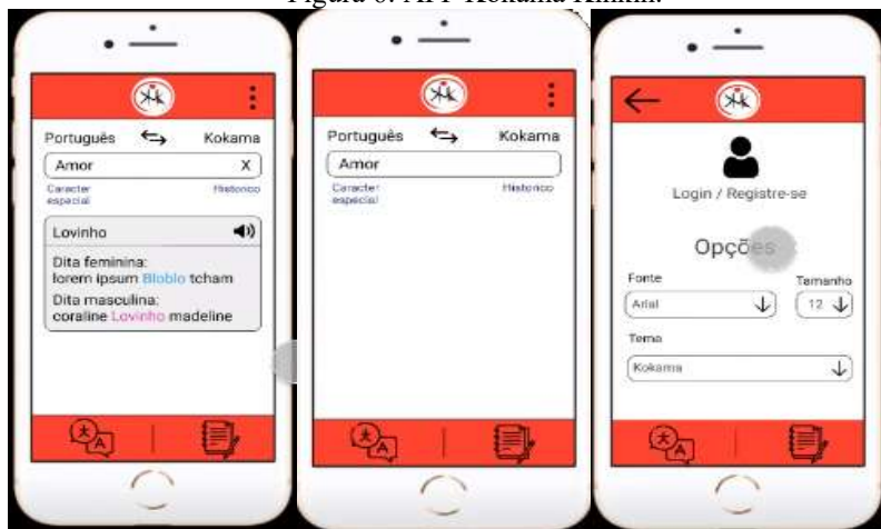
Figura 6: APP Kokama Kinkin.