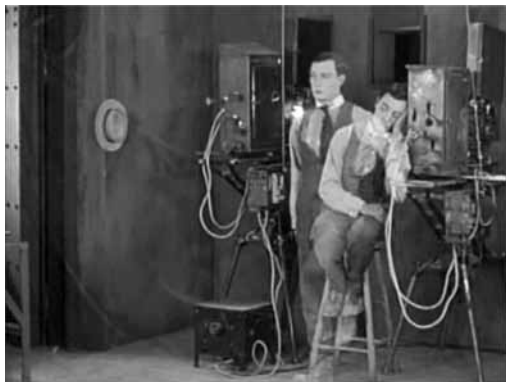
Figura 1 - Sherlock Junior (1924)

Vale recordar que sobreposições de imagens são um recurso do qual algumas exceções do cinema clássico já se valeram. São reconhecidas, e bons exemplos, a cena do sonho do cinematógrafo em Sherlock Junior (1924), de Buster Keaton (Figura 1), e várias passagens de O homem da câmera (1929), de Dziga Vertov (Figura 2), que usaram múltiplas exposições e máscaras para que apenas a parte desejada de cada fotograma fosse exposta à luz. Mas o que nesse cinema é ressalva, no vídeo é recorrência e marca estética potencializada pelo meio eletrônico.