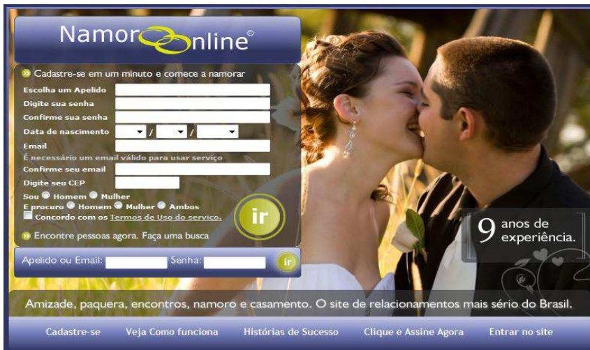
Figura 3: Namoro Online.

saber, é que essa definição de “discurso” só poderá ser estabelecida se for comprovada, de igual maneira, a existência das formações discursivas – o que acontece mais adiante; aqui, essa reflexão se coloca apenas como cautela. A descrição de um enunciado não deve se ater somente a seu segmento horizontal, mas se dirigir, segundo uma dimensão de certa forma vertical, às condições de existência dos diferentes conjuntos significantes (FOUCAULT, 2007). Por isso a necessidade de relacionar os componentes verbais, não verbais e os domínios associados de um enunciado como um “todo significante”, como fizemos na análise dos dois primeiros sites de relacionamento. Em resumo: ao examinar o enunciado, o que se descobriu foi uma função que se apoia em um conjunto de signos que requer, para se realizar, a) um referencial; b) uma posição-sujeito; c) um campo associado; d) uma materialidade repetível. Esses são os aspectos a serem levados em conta pelo analista de discurso ao deparar-se com os enunciados que compõem seu corpus .