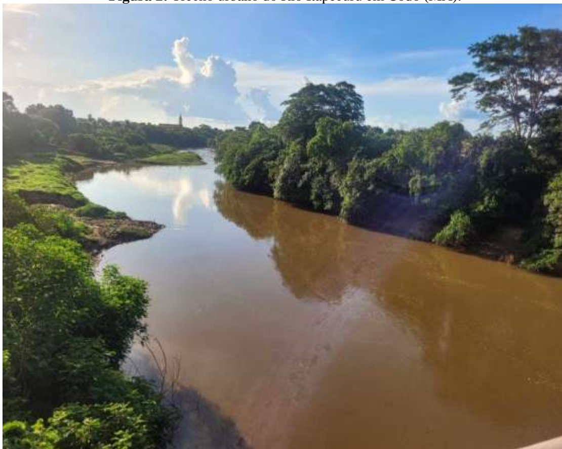
Figura 2: Trecho urbano do Rio Itapecuru em Codó (MA).