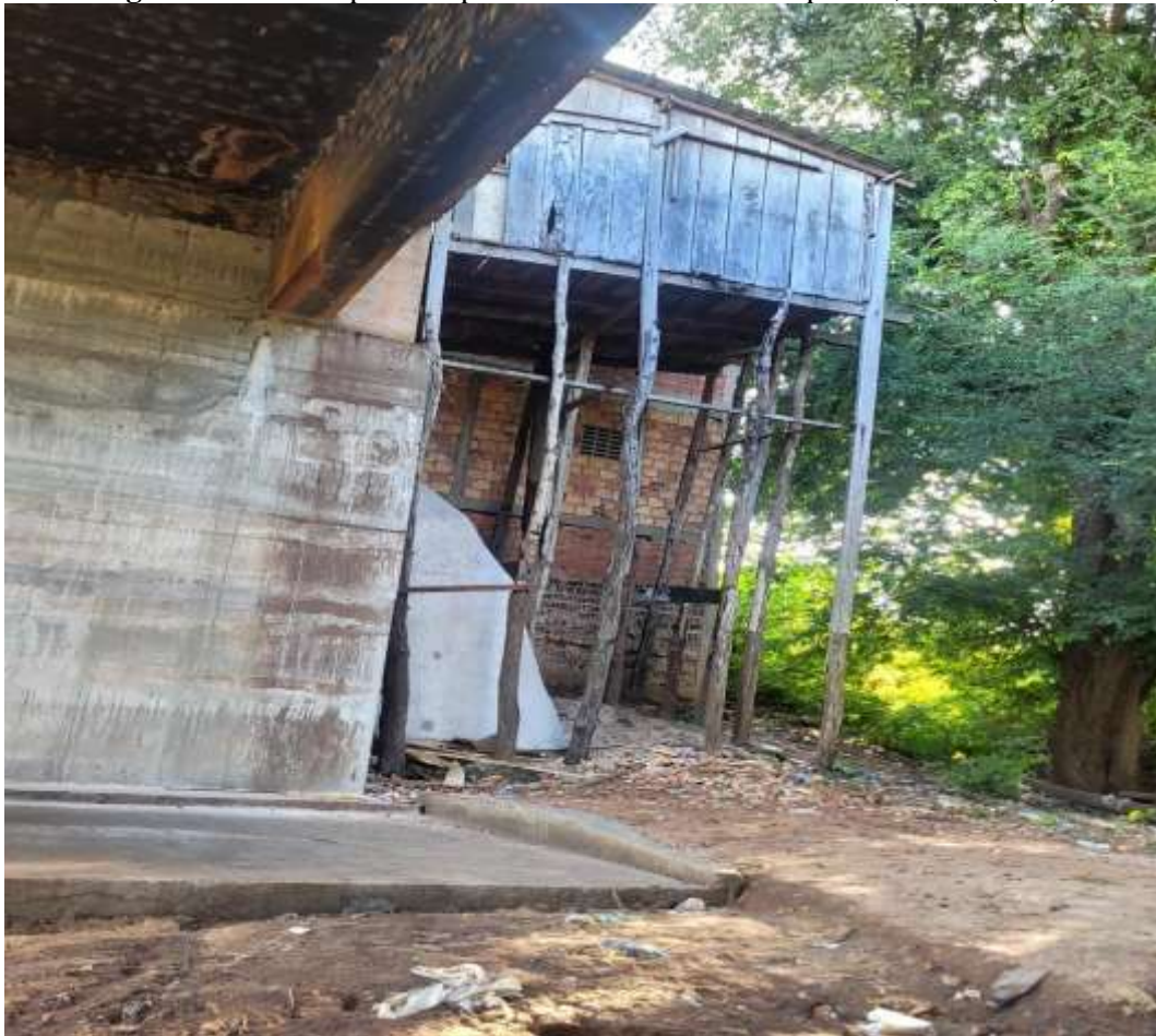
Figura 3: Moradia precária próxima ao leito do Rio Itapecuru, Codó (MA).