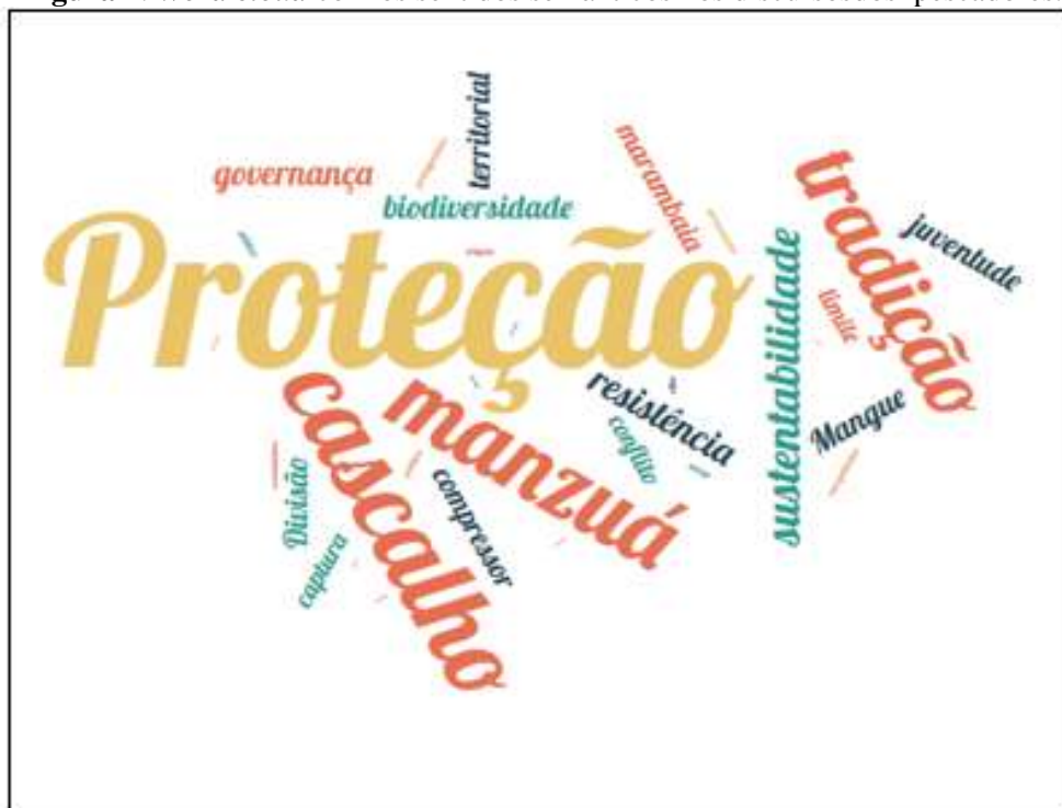
Figura 2: Word cloud com os sentidos semânticos nos discursos dos pescadores.

A Figura 2 apresenta uma nuvem de palavras gerada a partir do software https://wordcloud.online/pt , com o objetivo de visualizar de forma rápida e intuitiva os termos mais frequentes utilizados nos discursos e documentos analisados referentes aos pesquisados, derivados de uma análise mais aprofundada dos dados: