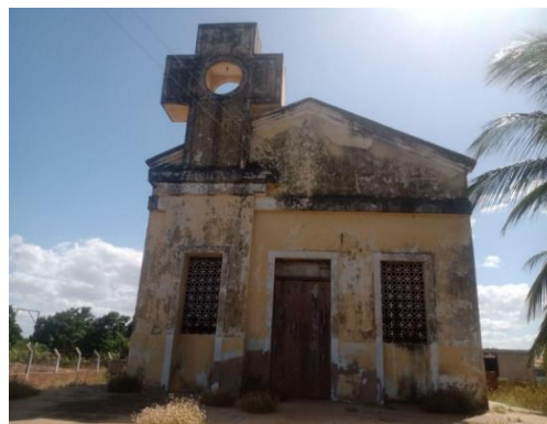
Figura 3: Capela de Santa Luzia em 2022.