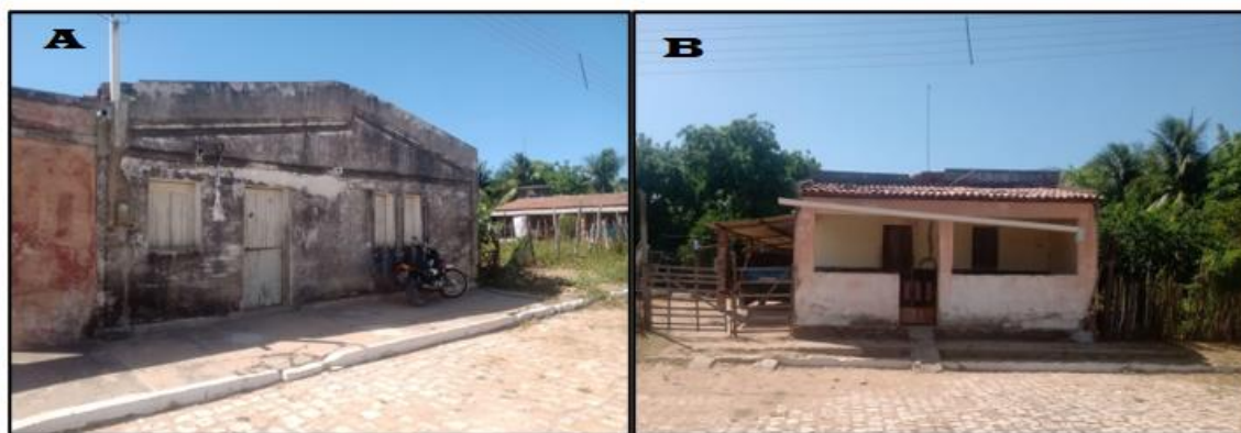
Figura 6: Casa construída antes da enchente de 1974 (A) e pós enchente (B).

Essa complexidade temporal é exemplificada nas figuras 6 (A) e 6 (B). A figura 6 (A) mostra uma casa construída antes da enchente, quando o local ainda era a sede do município, representando um objeto-forma de uma temporalidade passada. Já a figura 6 (B) mostra uma moradia construída após a enchente, no mesmo terreno onde antes estava a Igreja Batista, demolida depois de 1974. Assim, ambos os objetos coexistem na paisagem atual, evidenciando as transformações espaciais e as heranças temporais deixadas pelo evento de 1974.