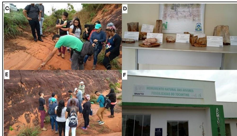
Figura 03 – Trabalho de campo em Geomorfologia.