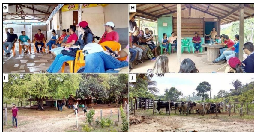
Figura 04 – Visita às comunidades na estrada do arroz