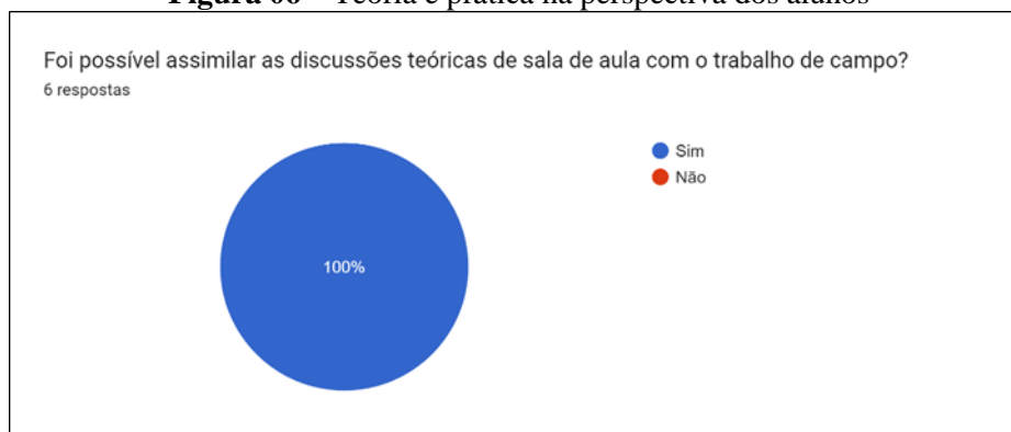
Figura 06 – Teoria e prática na perspectiva dos alunos