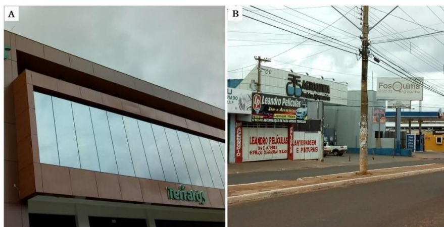
Figura 02 (A e B) – Espaço Urbano de Araguaína e seus agentes