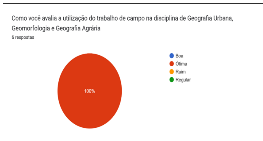
Figura 05 – Avaliação dos alunos sobre o trabalho de campo

Quando questionados a respeito do uso do trabalho de campo nas disciplinas de Geografia Urbana; Geomorfologia e Geografia Agrária , todos os discentes avaliaram como uma “ótima” experiência