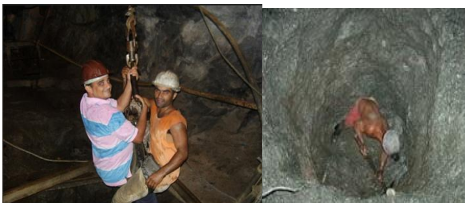
Figura 01: Gancho improvisado, falta de segurança e insalubridade dentro das catas

Dentre todas as precarizações do trabalho, uma delas se destaca, e é justamente a “classe” mais baixa dentro do garimpo de esmeraldas. Esse trabalhador é conhecido como cortador, que apesar do nome, não corta, e sim quebra as rochas com picaretas, visando reduzir o tamanho dos fragmentos para então enviá-los à superfície. Além de realizarem o trabalho mais penoso, utilizam como EPI's 14 , apenas botas de borracha e capacetes, sempre trabalhando de bermudas e sem camisa, devido as altas temperaturas no interior 15 das catas . Esses trabalhadores ainda precisam descer ao fundo da cata em ganchos improvisados. Ambos os cenários podem ser visualizados na Figura 01.