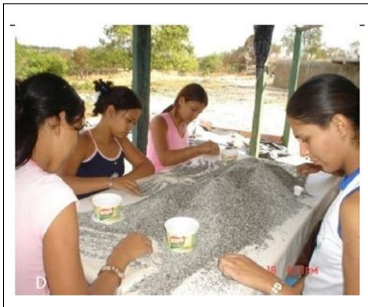
Figura 03 - Mulheres trabalhando na “cata” da areinha em Campos Verdes/GO