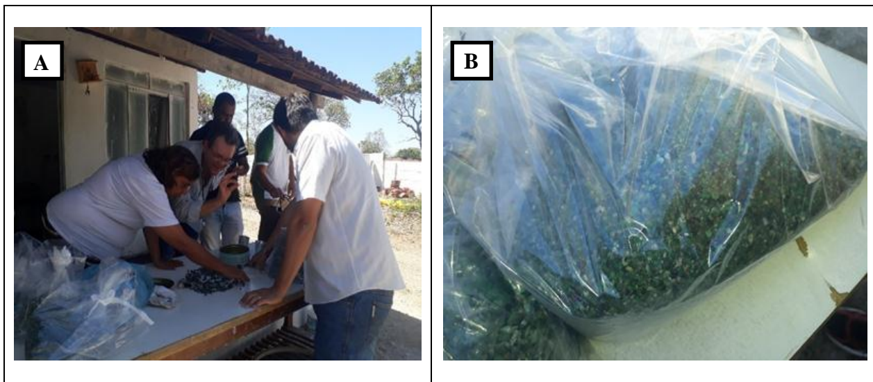
Figura 02 – Fotografia A e B: avaliador procedendo a separação das pedras em Campos Verdes/GO

Após a quebra do xisto, as “pedras” de esmeralda existentes são extraídas e reunidas. Nesta etapa, entra em cena o “classificador” (Figura 02 – A/B). Este papel deve ser desempenhado por pessoa da mais alta confiança do dono da mina, pois é o responsável por classificar as esmeraldas de acordo com a qualidade. Em geral, são denominadas como pedras extras, boas, medianas e fracas.