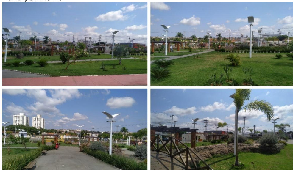
Figura 1 - Praça Duque de Caixas, popularmente conhecida como a “Praça da Feira”, em 2021.