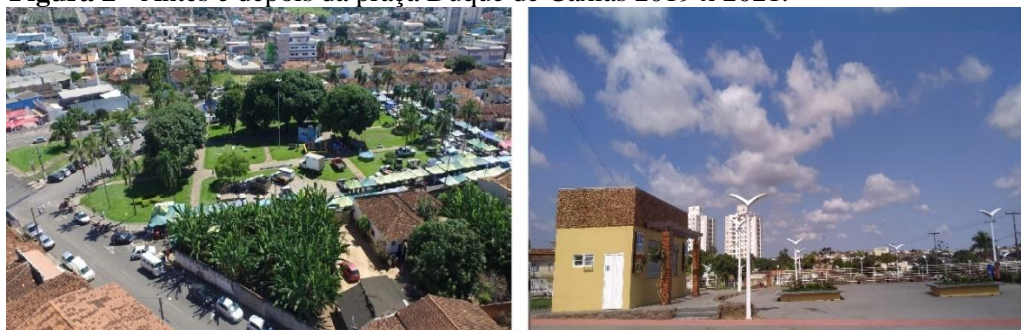
Figura 2 - Antes e depois da praça Duque de Caxias 2019 x 2021.

Fonte: Arquivo pessoal dos pesquisadores. Org. MENDES (2022).