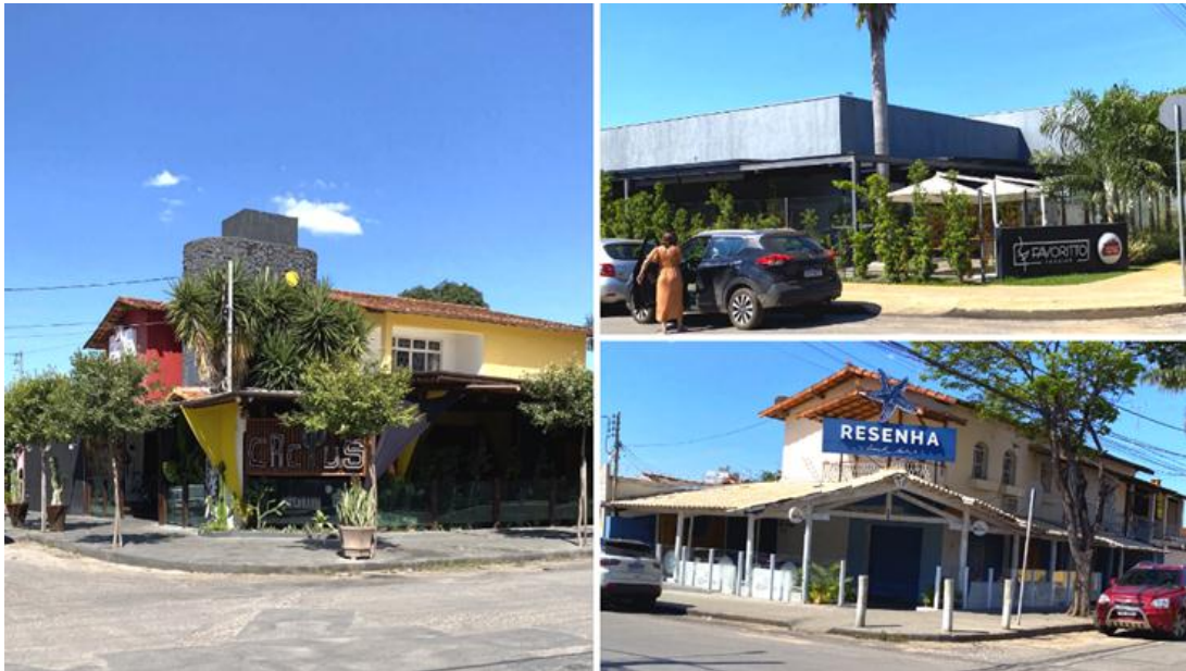
Figura 8 – Pontos comerciais desenvolvidos