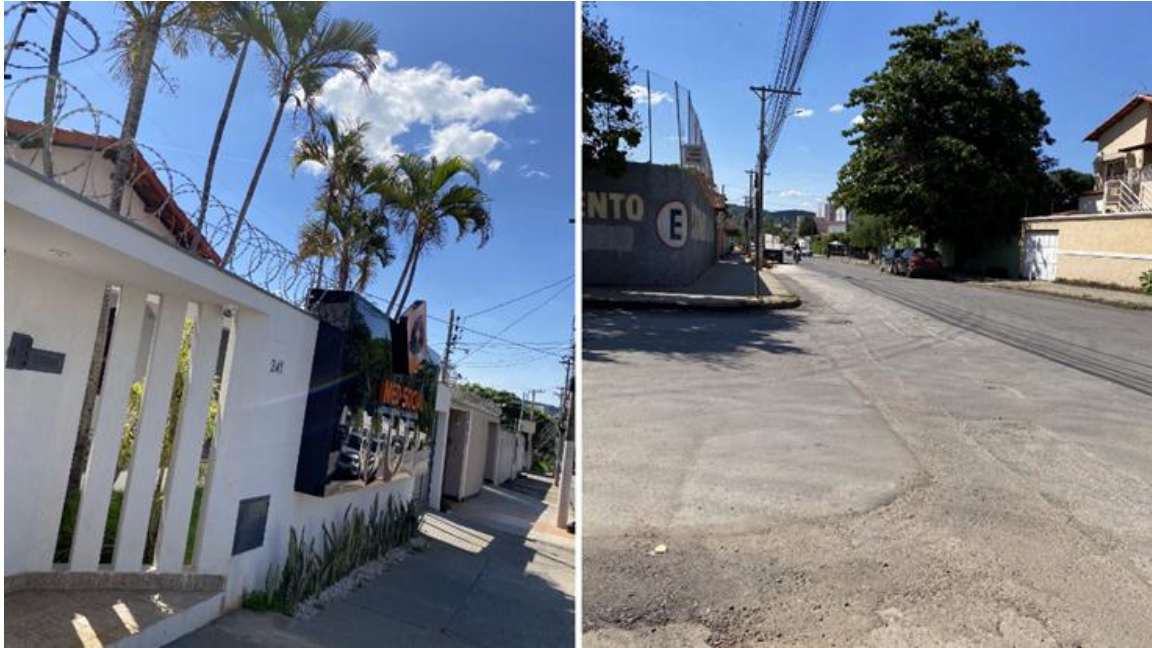
Figura 5 – Aspecto residencial

feitas previamente, a rua supracitada apresenta em maior parte um cenário urbanístico comum, contendo placas de sinalização de orientação, parada, estacionamento, direção, entre outras, além de rampas de acessibilidade, dentre outros aspectos.