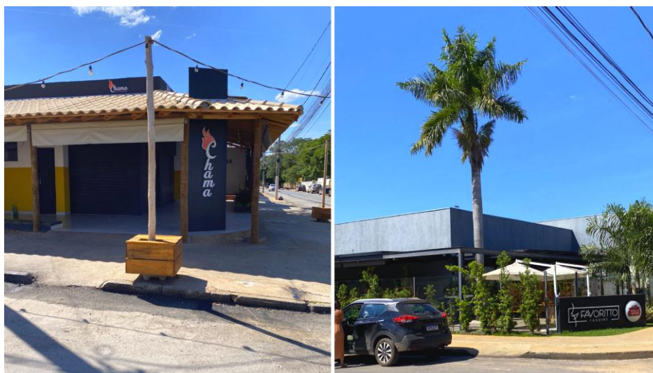
Figura 9 – Favoritto Jardins e Chama Espetos

(preço) de seus bens e serviços, mas também na construção estética e comunicacional desses locais, criando diferentes perspectivas de possíveis experiências. De forma específica se pode tomar dois pontos comerciais da via analisada como exemplos, o restaurante Favoritto Jardins e o Chama Espetos (figura 9).