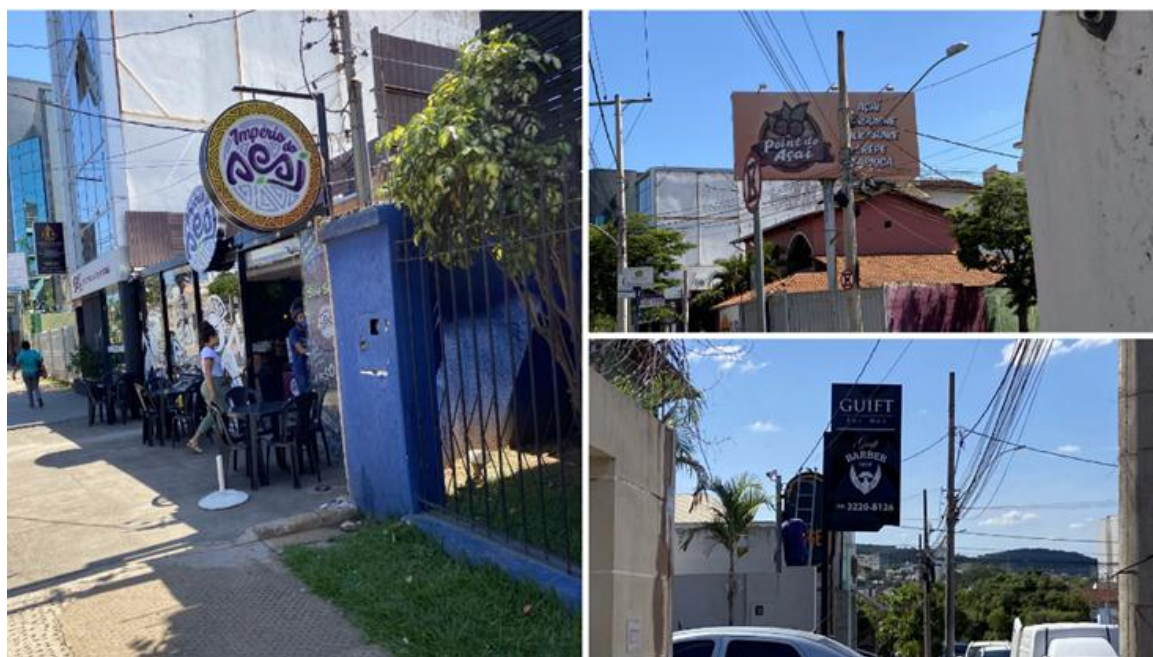
Figura 2 – Aspectos comunicacionais

Alguns pontos comerciais da Avenida Deputado Esteves Rodrigues se destacam por suas construções estéticas, os mesmos possuem maior desenvolvimento em suas configurações espaciais com foco em atividades neurossensoriais (figura 2).