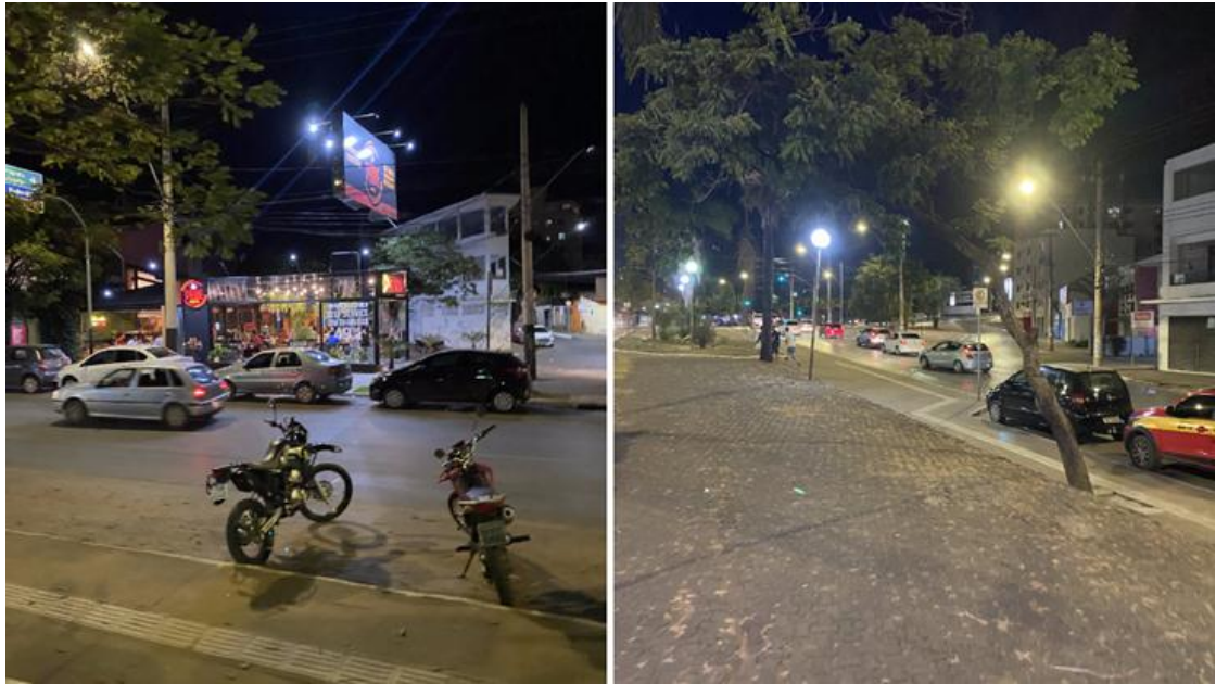
Figura 7 – Fluxo na Avenida Sanitária