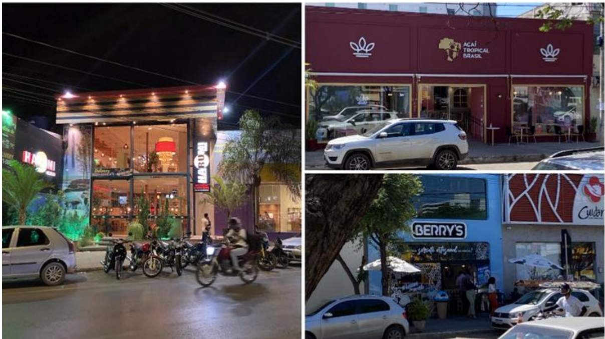
Figura 3 – Logradouros estilizados

Estabelecimentos como as franquias Açaí Tropical Brasil e Domino's Pizza e outros como o Harumi Sushi, Berry's e Pede Pizza, que se encontram na Avenida Deputado Esteves Rodrigues, apresentam estéticas próprias, mais bem desenvolvidas, com espaços instagramáveis 3 , estabelecendo uma diferenciação mais clara dentro do cenário da avenida, recebendo maior destaque, o que pode ser observado até pela iluminação no período noturno (Figura 3).