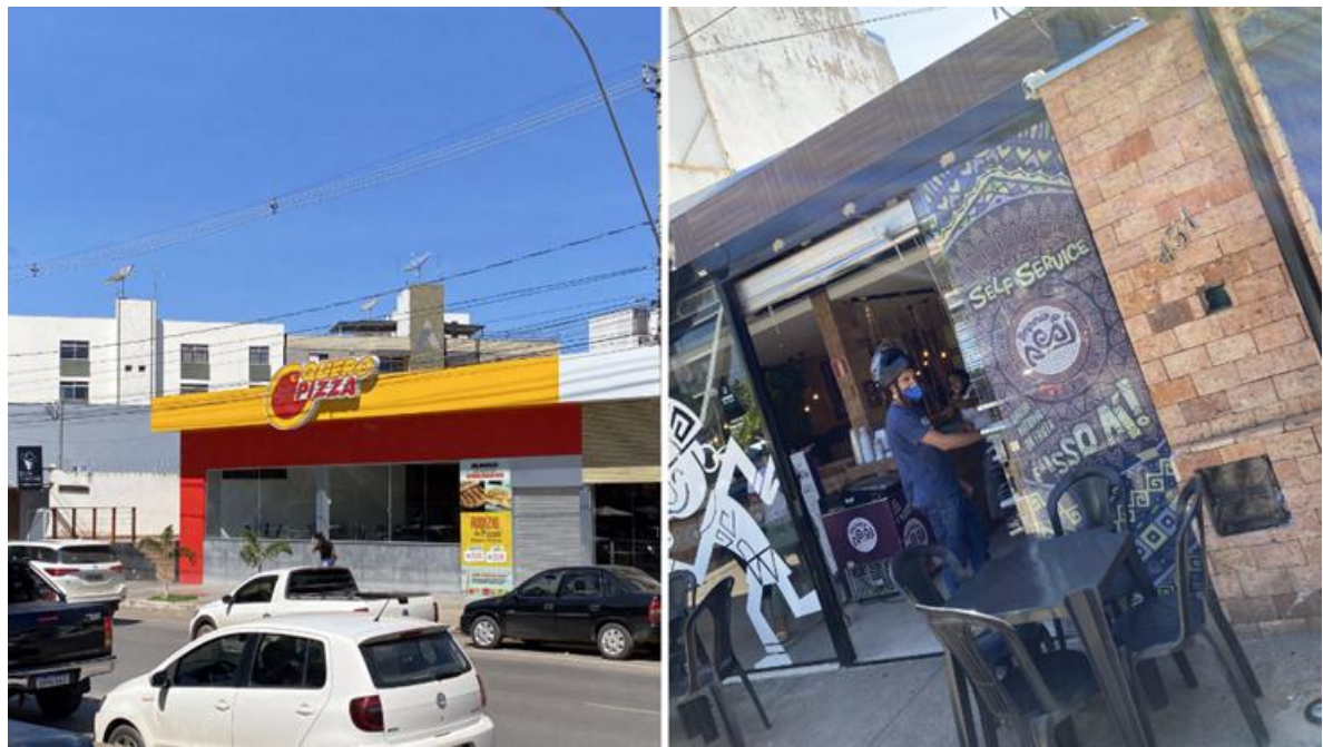
Figura 4 – Pontos comerciais simples

sua experiência 4 . Esses estabelecimentos podem carregar a interpretação de serem mais caros, em relação aos demais, mas isso não impede a ativação do desejo no consumidor através da imagem. Outros pontos comerciais como o Quero Pizza e o Império do Açaí se apresentam de forma mais simples, suas fachadas se destacam através de cores, apresentando também a temática e a experiência como diferenciais, podendo aparentar serem mais acessíveis, entregando também satisfação ao consumidor (figura 4).