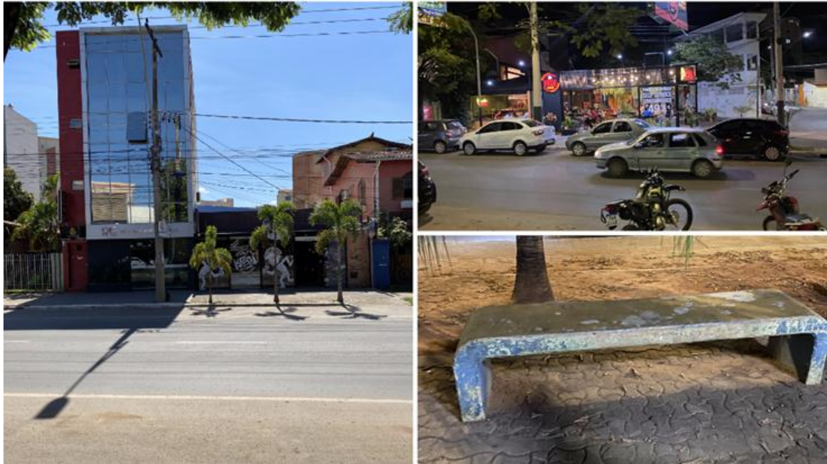
Figura 1 - Aparência da Avenida Sanitária