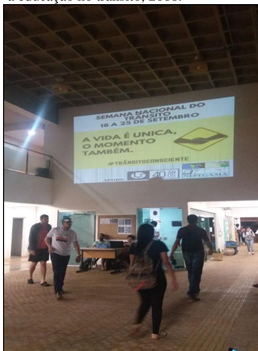
Figura 11 - Alunos passando pelos corredores e observando a exposição sobre a educação no trânsito, 2018.

E ao aplicar alguma atividade na comunidade com viés de conscientização, e consequentemente mostrar todo o trabalho e esforço no seu centro de estudo, torna-se algo prazeroso, pois o resultado é positivo a partir do momento que público presente percebe a notoriedade e tal relevância.