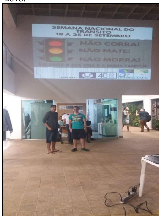
Figura 10 - Bolsistas iniciando a exposição sobre educação no trânsito, 2018.

Sendo assim, iniciou-se a exposição de slides para ressaltar a importância da educação no trânsito. Em seguida, foi possível analisar que as pessoas que passavam no Hall do bloco B, logo tinham sua atenção atraída para a apresentação. Como é demonstrado nas Figuras 10 e 11.