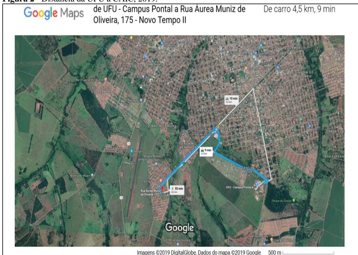
Figura 2 - Distância da UFU a CAIC, 2019.

O exposto trabalho foi dividido por etapas, como citado anteriormente na metodologia. Diante disso, a parte prática foi realizada em uma escola pública, localizada a cerca de 4,5 km da Universidade Federal de Uberlândia – Campus Pontal em Ituiutaba, conforme observa-se na Figura 2.