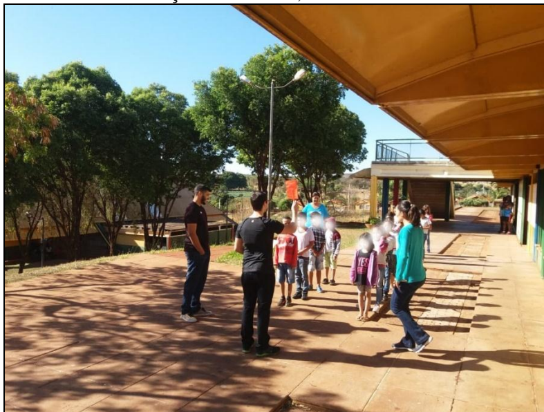
Figura 8 - Comportamento dos alunos no pátio da escola em lidar com as devidas situações de trânsito, 2018.

Após a explicação e conseqüentemente o entendimento, os alunos foram convidados a seguir para o pátio já sendo instruídos pelos discentes da UFU. Em cada situação, existia uma pergunta aos alunos sobre o que fazer naquela devida circunstância, caso o estudante acertasse, prosseguia o caminho, caso contrário a resposta era formulada corretamente com o cenário. De acordo com as Figuras 8 e 9.