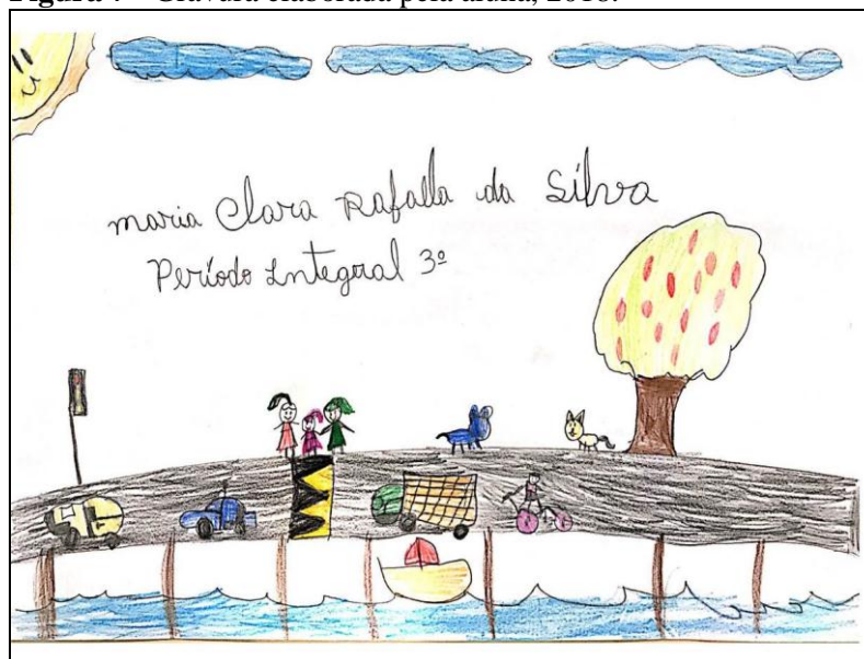
Figura 7 - Gravura elaborada pela aluna, 2018.