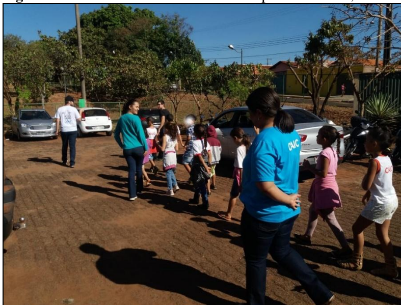
Figura 9 - Alunos realizando atividades no pátio da escola, 2018.