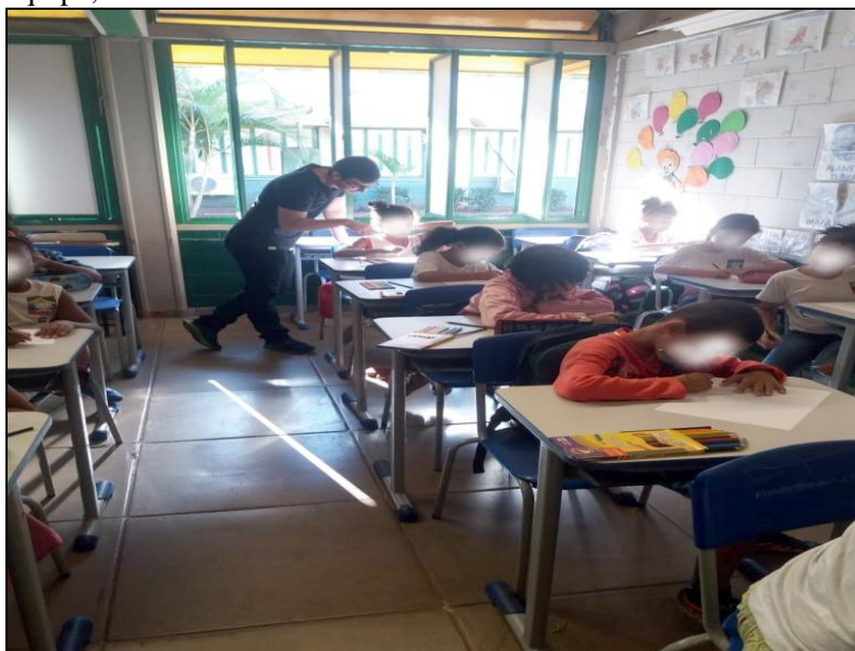
Figura 4 - Alunos desenvolvendo as atividades propostas pela equipe, 2018.

frases ou ambos, assim despertando além de tudo o entendimento sobre a atividade, conforme ilustra as Figuras 4 e 5.