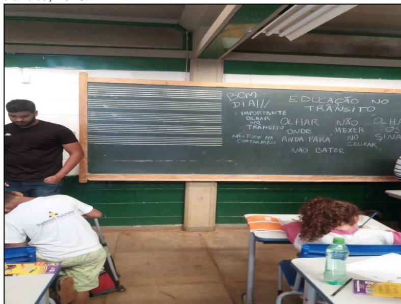
Figura 3 - Frases dos alunos ao compreender o que é educação no trânsito, 2018.

Com isso, os alunos começaram a deduzir o que estava escrito, e a partir deste despertamento, surgiram frases sobre o assunto, no qual foi escrito no quadro as respostas mais relevantes.