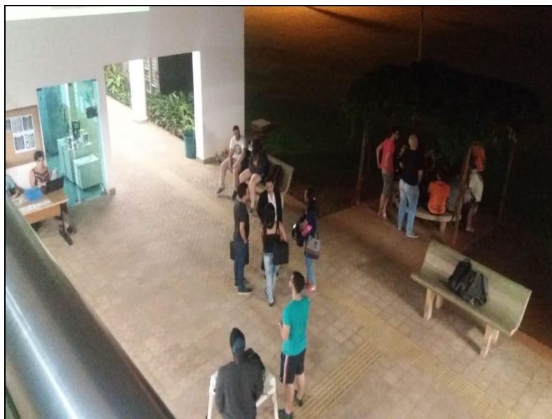
Figura 12 - Público dialogando e interagindo com o tema exposto, 2018.