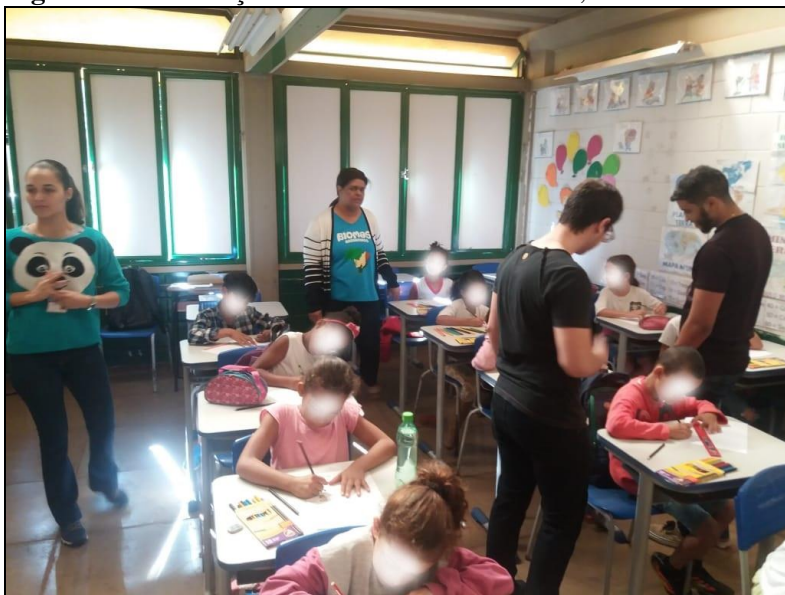
Figura 5 - Observação das atividades dos alunos, 2018.