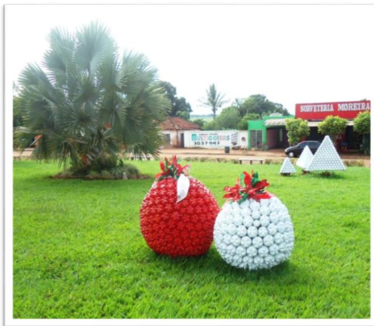
Foto 2. Praça pública no centro da cidade e os enfeites de Natal

Fonte: Elaboração dos autores a partir de trabalhos de campo realizados de 2014 a 2017.