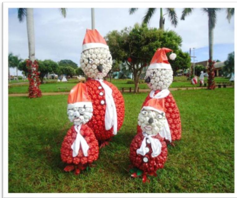
Foto 1. Família de boneco de neve representada nos enfeites expostos na praça de Aparecida do Rio Doce (Goiás)