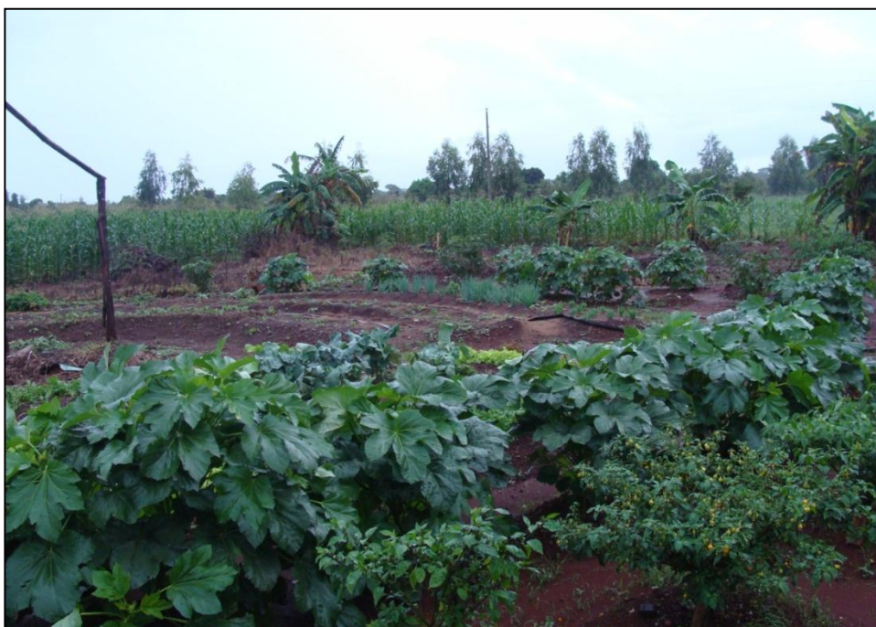
Foto 3: Pés de pimenta (primeiro plano a direita) e quiabos circulando a horta do PAIS ao centro, além de milho e bananeira ao fundo.

verificamos o cultivo de hortaliça por meio do PAIS e ainda o plantio de pimenta, expressando a diversidade através da agricultura camponesa. (Foto 5).