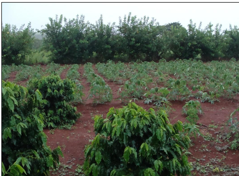
Foto 1: Mudanças de café fornecidas pela Rede Terra e plantação de mandioca, resultado do próprio trabalho camponês, ao fundo cerca viva, também utilizada como barra vento.