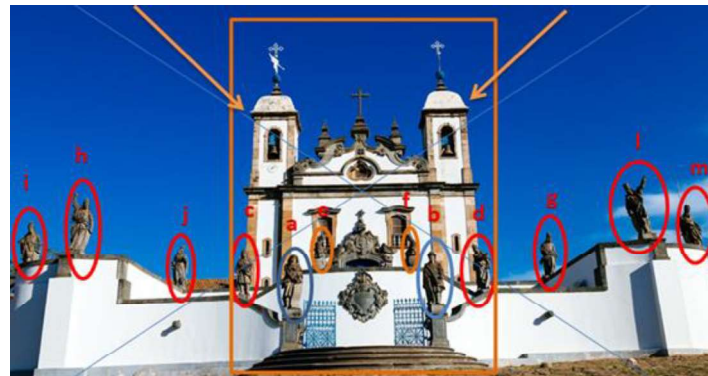
FIGURA 1: Santuário de Bom Jesus do Matosinhos