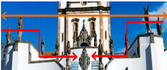
FIGURA 3: Recorte - Santuário do Bom Jesus de Matosinhos

Também observamos acima que as esculturas dos “Doze Profetas” estão expostas no Adro em frente ao Santuário do Bom Jesus de Matosinho, de maneira geometricamente organizada, em sua predisposição na entrada. Aqui parece visivelmente ser este um trabalho de um verdadeiro arquiteto.