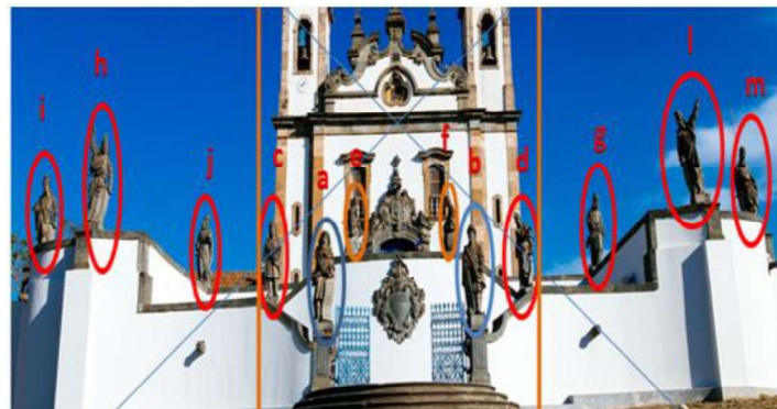
FIGURA 2: Recorte - Santuário do Bom Jesus de Matosinhos

estátuas foram esculpidas em pedras-sabão. Essas obras, feitas com detalhamento e perfeição, são importantes representantes da “genialidade” do artista brasileiro e se sobressaem no cenário do estilo barroco no nosso país”. (OBRAS DE ALEIJADINHO, 2020).