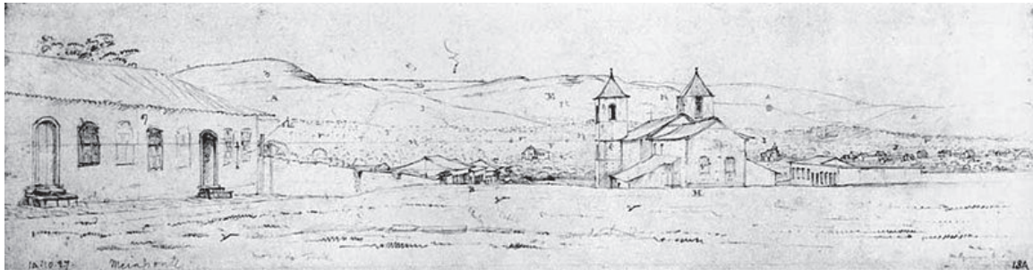
Figura 6 – Vista da Cidade de Meia Ponte por William Burchell (1827)