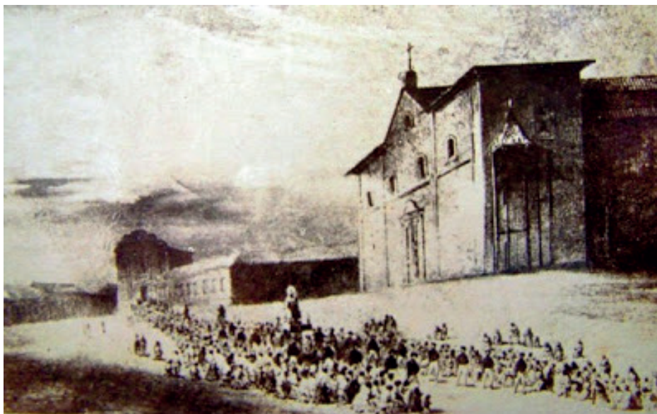
Figura 5 – Procissão no Largo da Matriz - Castelnau (1844)

Ainda sobre a mesma praça do desenho de Burchell, Castelnau anota: “No mesmo largo do palácio ergue-se a Matriz, ou Catedral, mais sumptuosa internamente do que por fora, como também a igreja da Boa Morte, cuja elegante fachada não ficaria deslocada em qualquer cidade da Europa” (CASTELNAU, 1949, p. 225). A figura 5 mostra a imagem da procissão no Largo da Matriz, produzida por Castelnau.