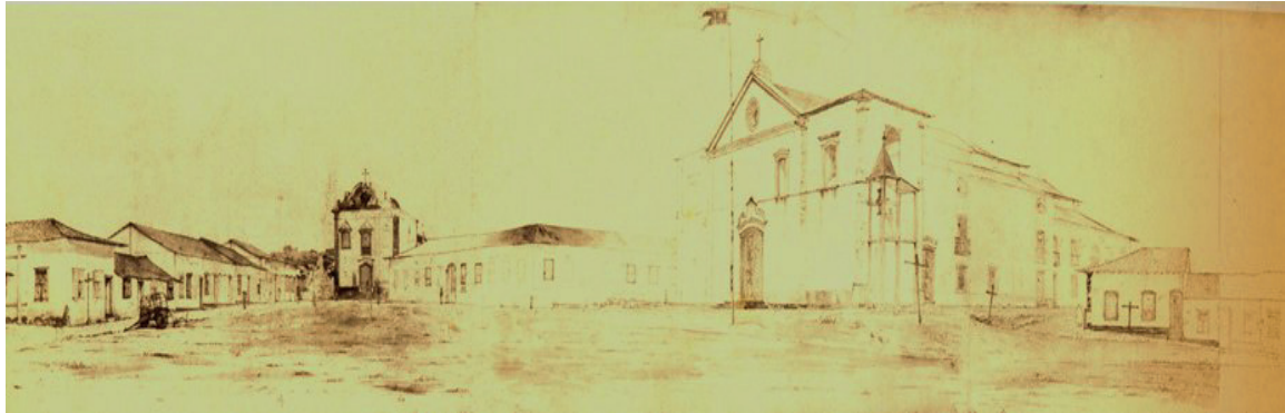
Figura 4 – Largo da Matriz (atualmente Praça do Coreto) por William Burchell (1827)