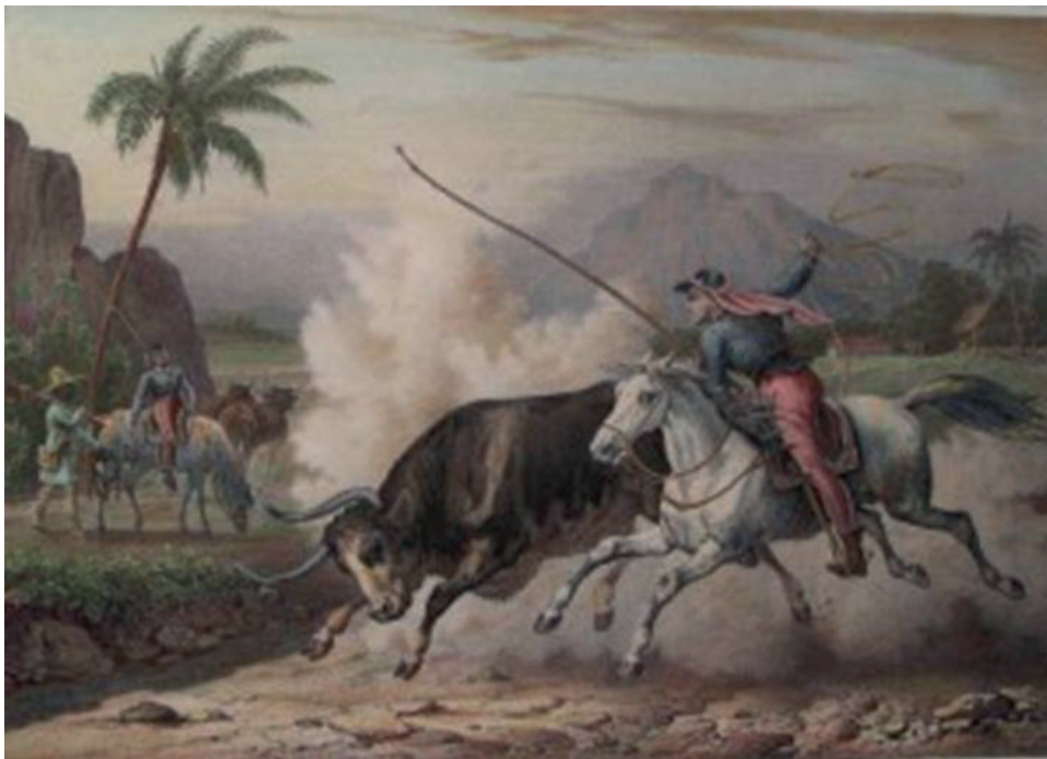
Figura 1 – Habitantes de Goyaz , de Johann Moritz Rugendas (s. d.)

É interessante notar que na obra Habitantes de Goyaz (figura 1), de Johann Moritz Rugendas 8 (1802-1858), por exemplo, os habitantes de Goyaz são representados com características dos vaqueiros dos pampas gaúchos e os animais que aparecem no quadro também são diferentes dos que havia na região em foco. Os artistas viajantes relatavam e pintavam de olhos fechados. Tudo o que sabiam ou viam era comparado com a velha Europa.